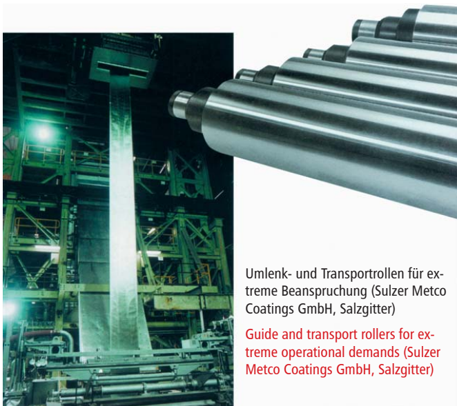
Umlenk- und Transportrollen für extreme Beanspruchung (Sulzer Metco Coatings GmbH, Salzgitter)

Components whose dimensions are too small due to production errors can be salvaged with thermal spraying.